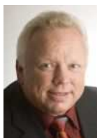
Bürgermeister Rainer Bersch