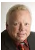
Bürgermeister Rainer Bersch