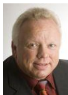
Bürgermeister Rainer Bersch